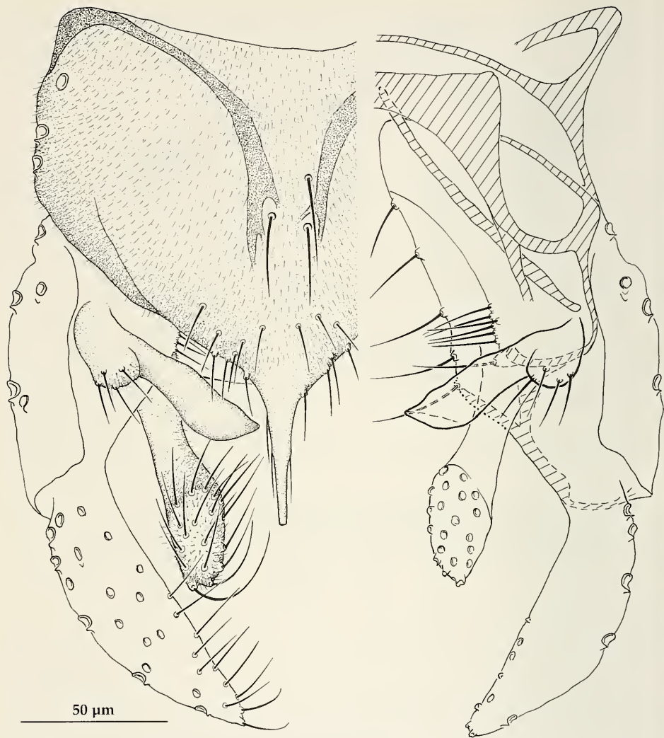
Abb. 2. Microtenidipes schuecki , spec. nov. Hypopygium dorsal.

dunklen Thorax- und Flügflecken sowie zum Teil mehrfach geringelten Beingliedern; Analspitze des Hypopygiums lang, schlank konisch, lateral mit mehreren eng anliegenden, langen Setae bestand, distal abgestutzt; obere Volsella mit typischem basallateralem Lobus, der mit langen Setae und Mikrotrichien versehen ist; mediane Volsella entweder ein mit Setae bestandener, unterschiedlich stark ausgebildeter Lobus oder nur durch eine Gruppe eng zusammenstehender Setae repräsentiert.